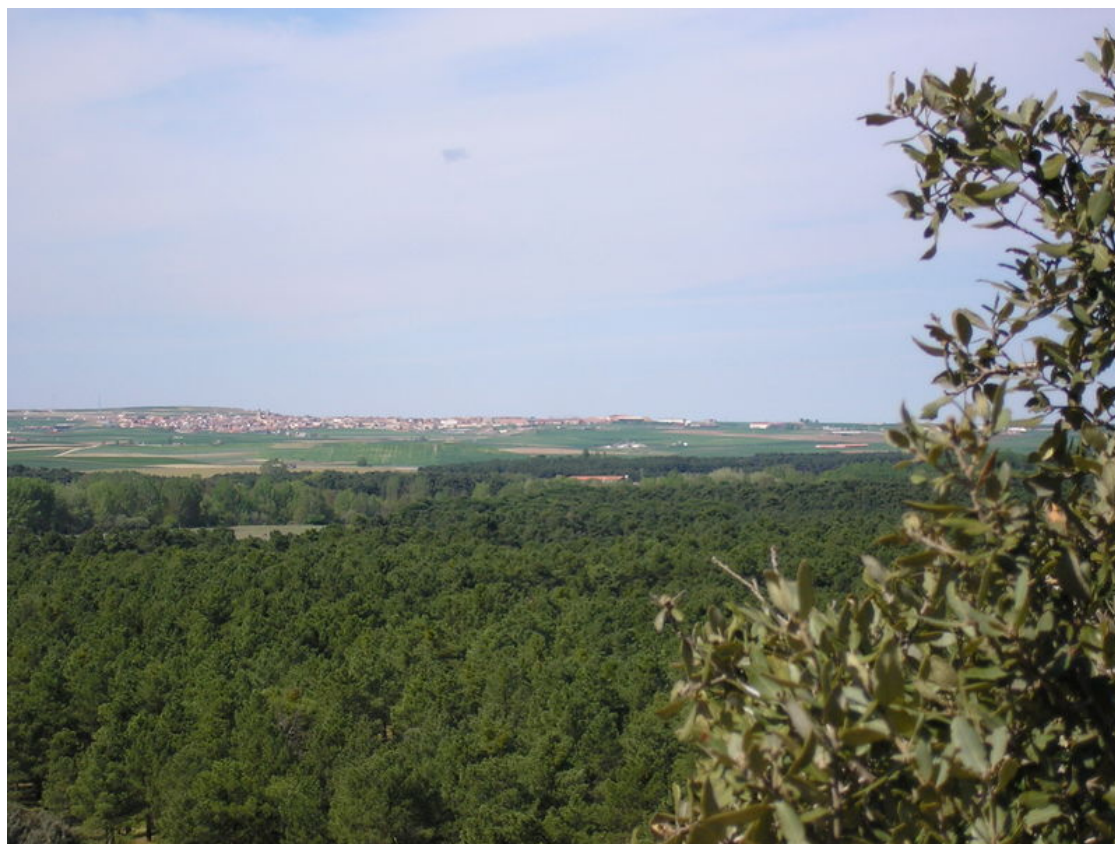
Vista de Carbonero el Mayor.

Salimos de Navalmanzano por el camino de Pinarnegrillo, el que comienza en los colegios. En pocos minutos llegamos al pueblo de Pinarnegrillo, pasamos la plaza dejando a la izquierda el ayuntamiento y tomamos la calle Neptuno (primera a la derecha), esta se bifurca y ahora tomamos la de la izquierda (calle Mozoncillo), esta calle da a un camino, de este a unos 100 metros a la derecha sale otro en un poco peor estado, lo cogemos y este camino nos lleva hasta el pinar en el que entramos por una pimpollada, seguimos recto hasta que a aproximadamente 1.5 Km se bifurca, tomando entonces el camino de la izquierda, siguiendo por el llegamos a otro cruce o incorporación donde despeja el pinar, a nuestra izquierda veremos un cartel que dice "Monte de utilidad Publica 154" desde aquí ya podemos divisar "La Cuesta", cogemos el camino hacia arriba y en poco mas de 1 Km estaremos en lo alto de "La Cuesta de Los Santos" donde podremos descansar y disfrutar del paisaje y las vistas panorámicas ya que desde este punto se divisan la mayoría de los pueblos de alrededor.