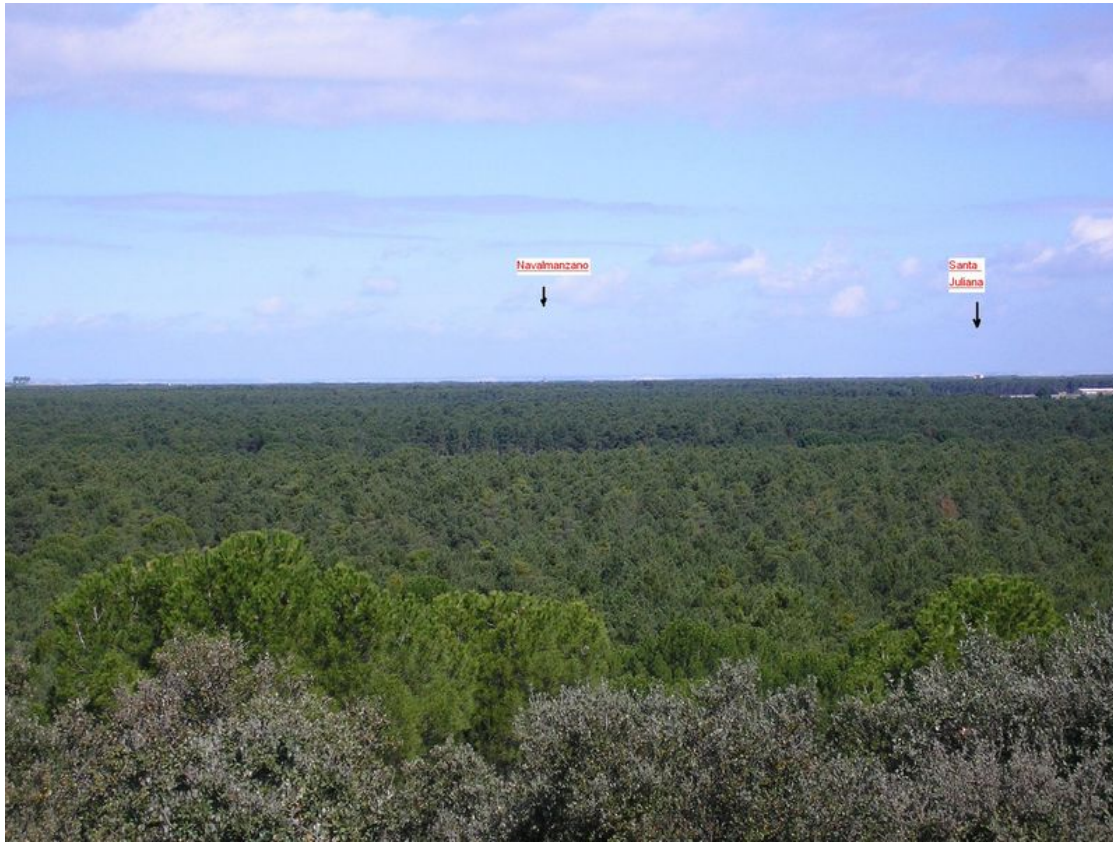
Vista de Navalmanzano.

De aquí volveremos a nuestro punto de inicio por el mismo camino.